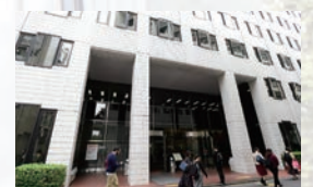
中央図書館 Central library