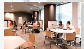
LLC LLC(Language Learning Commons)