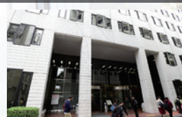
中央図書館 Central library