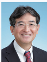
上智大学後援会 会長