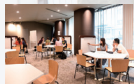
LLC LLC(Language Learning Commons)