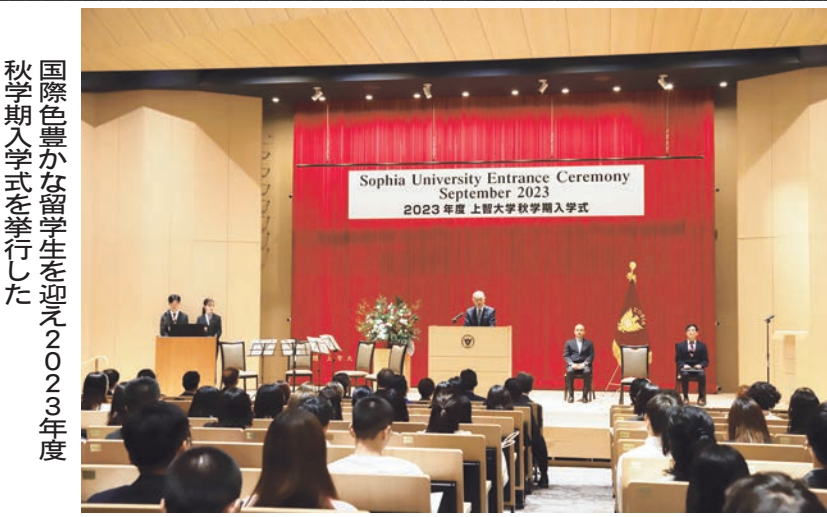
国際色豊かな留学生を迎え2023年度秋学期入学式を挙行了した

「最も弱い立場の人を優先する」という根本的な価値原則があります。上智の教育精神『For Others, With Others』とともに皆さんが有意義な大学生活を送ることを期待しています」と述べた。