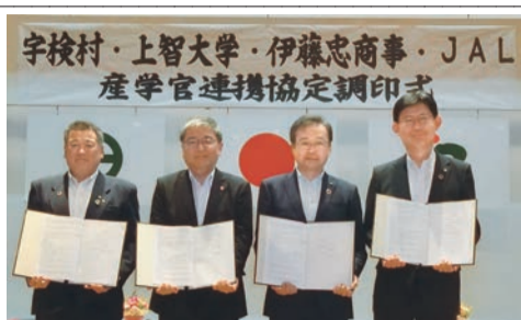
宇検村・上智大学・伊藤忠商事・JAL産官学連携協定調印式

9月17日、上智学院、鹿児島県の奄美大島南部に位置する宇検村、日本航空株式会社、伊藤忠商事株式会社の4者は、宇検村での環境保全と地域振興に取り組むことを目的に、連携協定を締結した。