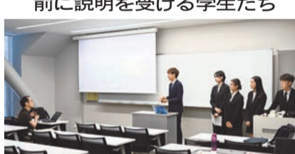
香港中文大学の学生と共にグループワークの成果を発表

8月14日から25日、本学と協定校の香港中文大学による連携講座を実施した。今年度は本学学生6人と、香港中文大学で観光学やホテル経営学を学ぶ9人の学生計15人が参加した。今回は、「Design Tomorrow's Retail Customer Experience」(小売顧客体験の新たなデザイン)がテーマに設定され、日本を代表する百貨店である株式会社高島屋が協力。新型コロナウイルス感染症の拡大により、従来の小売業の在り方が大きく変わったことを受け、新たな顧客体験を提案する課題が提示された。