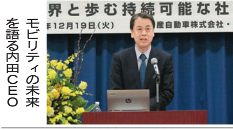
モビリティの未来を語る内田CEO

の社会のために「生理の貧困」では、ジェンダー・セクシュアリティ問題に取り組む学生団体GSES (Gender Equality for Sophia)のメンバーが参加。生理