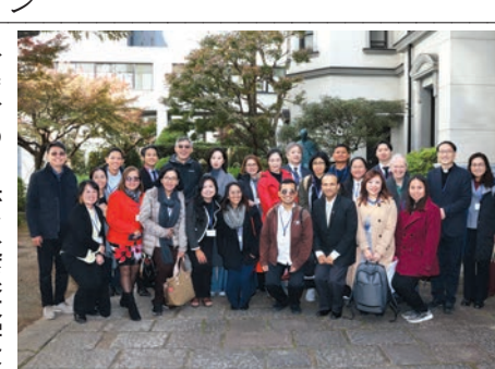
アジアのイエズス会系大学などのスタッフが一堂に会した