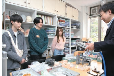
研究室で教員から説明を受ける新入生

4月3日から5日の3日間にわたり、四谷キャンパスでオリエンテーション・デイが学部学科ごとに開催された。本学の教育精神である「他者のために、他者とともに」を体現する伝統的な行事で、新入生がスムーズに大学生活を始められるよう、勉学や学生生活に関するガイダンスを行うことを目的としている。かつては「オリエンテーション・キャンプ」と呼ばれ、宿泊