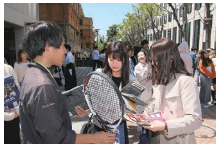
160もの課外活動団体が参加した

この企画はフレッシュマンウイーク実行委員会が主催し、約160の課外活動団体が参加する新入生歓迎イベント。今年度は4月9・10日の2日間にわたり開催された。特設ウェブサイトやSNSでは、新入生が効率的に会場を回れるように情報を整理して公開したほか、学食や売店など新入生向けに役