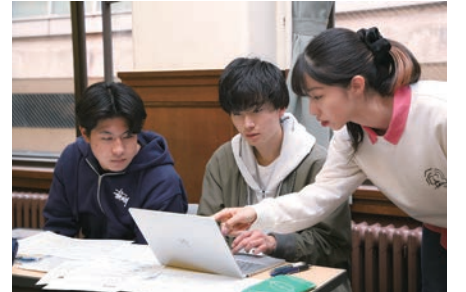
新入生にアドバイスをする学科ヘルパー

学科集会では、教員の紹介、学科のガイダンスや履修登録の説明などが行われた。また、「学生ヘルパー」と呼ばれるボランティアの上級生も参加。会場では終始和やかな雰囲気の中で、新入生は上級生から履修や学生生活のアドバイスを受け、同級生とも親睦を深めた。