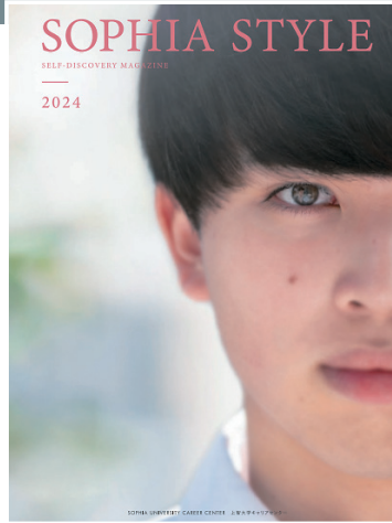
今年のテーマはForge your journey

キャリアセンターの担当者は、「学生生活は社会に出る準備の場であり、在学中にどんなことでも良いので夢中