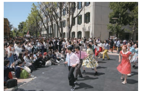
上級生がパフォーマンスで盛り上げた

メインストリートや各教室に配置されたそれぞれのブースでは、課外活動団体に所属する上級生たちが、揃いのユニフォーム姿でプラカードなどを掲げ、活動内容の宣伝を行った。新入生は、次々に話しかけてくる上級生に最初は戸惑いながらも、団体の活動や大学生活全般の話などに熱心に耳を傾けていた。