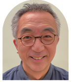
メディア評論家・ 研究者・ジャーナリスト 水島 宏明

春学期開講日程 第1回 5/12(月) 18:30～20:00 第2回 5/26(月) 18:30～20:00 第3回 6/9(月) 18:30～20:00 第4回 6/23(月) 18:30～20:00