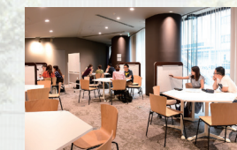
LLC LLC(Language Learning Commons)