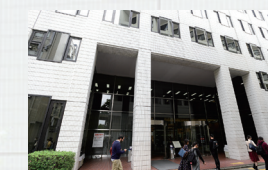
中央図書館 Central library