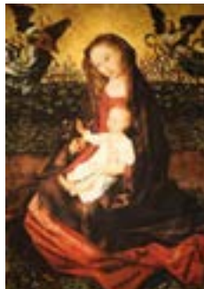
“The Virgin and Child with Two Music-Making Angels” by Rogier Van Der Weyden