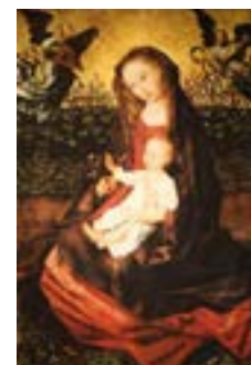
“The Virgin and Child with Two Music-Making Angels” by Rogier Van Der Weyden

Global化が進み、Diversityの重要性が叫ばれる世界であって、上智大学のキャンパスそのものが日本と世界のさまざまな国と地域からの学生であふれ、多様な文化が触れ合う場となっています。このような場で学生生活を送るみなさんが有意義な日々を過ごすことができますように。