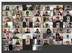
オンラインガイダンスから交流

新しい人間関係を築きながら経験を共にする機会が、高校生にとって普段と異なる刺激や世界の広がりとなっていました。