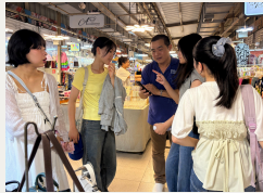
フィールドワークトレーニング 各エリアで小さなミッションを持ったグループ行動時間や、公共交通の利用機会などをとりいれ、自己管理しながら新しい土地を探索したり、学びの機会を自分たちの力で創って広げるスキルを実践的に伸ばしました。

大学や将来に向け、自ら考えて動き、自由度を活かす力を伸ばす機会を意識。大学訪問など比較的内容まで用意された活動から、徐々にテーマや手段を自分で設定して実践するフィールドワークなど参加者自身が考えたり決めたりする活動へ移行。参加者みんなでルールを決めての自由行動時間も設定しました。責任や難しさも含めて自律的な活動の面白さを経験し、できることが増える自信もつけながら、先への姿勢に繋がりました。