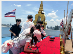
仏教寺院訪問（2日目） バンコク市内の仏教寺院を訪問し、現地スタッフに教わったり、現地の方々の様子を見ながら参拝やおくじなどを体験。自らの体感を持って、タイに根づく仏教をはじめとする文化を学びました。

自らの経験を持って多角的にタイを捉えたり、多様な経験から個人に応じて学ぶポイントを見出したりできるよう、思考の材料となる多くの経験・実体験を重ねました。