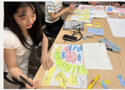
ラップアップ：経験や思考の整理（5日目） 日々書き溜めた記録から付箋に書き出すと数十枚に。繋がりと重なる考えながら全体を整理し、プログラムを通じた自分の学びを掴みました。「紙がこんなにうまそうと思っていて驚き！知らない間に成長したんだと気づいた」と実感も。