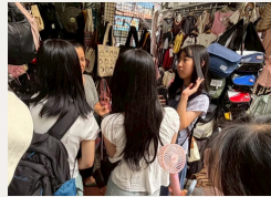
自由探索フィールドワーク（5日目） 自分達で目的・行き先・活動を設定して自由探索。興味に関連するエリアを探して散策したチーム、テーマを設定して現地の人へのインタビューにもチャレンジしてタイの理解を深めたチームなど、メンバーの協力で積極的に行動できました。