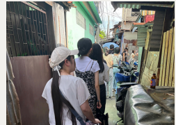
スラム地域支援団体訪問（3日目） 貧困層の方への支援団体を訪問。日本人スタッフの方にお話を伺うことに加え、地域を実際に歩き、暮らしの様子に触れつつ、住民の方々と接点を交わしたりし、多様な立場の人に直接関わりながら実態を見て考えました。