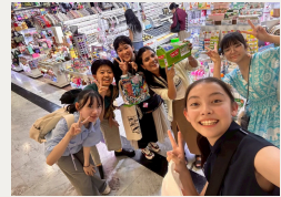
自由行動時間 みんなで決めたルールに沿って、ホテル戻り後の時間も近隣を散策しタイを体験できる時間に。自分達でしっかり管理・判断しながら新しい地で活動する力を実践的に伸ばし、それができると広がる機会や可能性を体感しました。