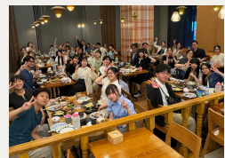
訪問先の方やメンバーとの食事でも対話の機会