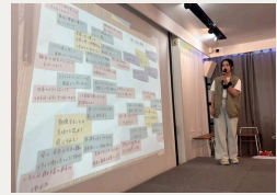
ラップアップ：各自の学びの発表（5日目） 付箋で整理した紙をスクリーンに投影しながら、1人1分で自分の学びを発表・共有しました。自分にとってプログラムがどんな機会だったかを表現したり、一人一人観点が異なることにさらに学びを得たり、実りある時間となりました。