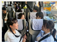
移動もメンバーとの貴重な時間