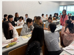
大学訪問（2日目） 上智大学の協定校でもあるタイトップ大学のマヒドン大学(A)・タマサート大学(B)を訪問。現地教員による英語レクチャーや、現地大学生との交流を通じ、大学での学びやタイ文化を教えてもらったり、ディスカッションに取り組めました。