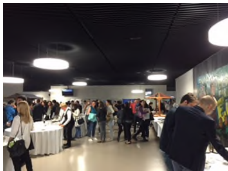
レセプションの様子