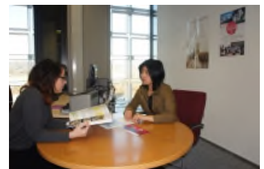
ルクセンブルクオフィスの様子

また交換留学生が希望すれば、ルクセンブルク大学学生課がルクセンブルク大学の学生と協力し、交換留学生の手助けをするバディ制度も利用できます。ルクセンブルク到着時にはルクセンブルク国際空港から寮、大学までの案内や、大学生活中の細々とした質問もバディ学生に聞くことができる制度です。