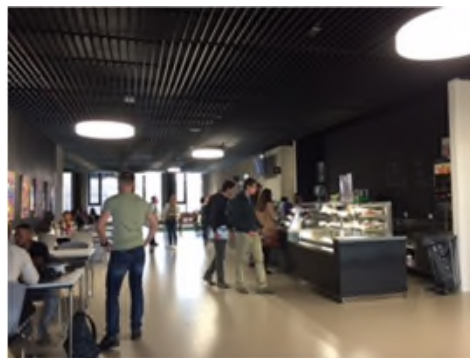
ホール内カフェテリア