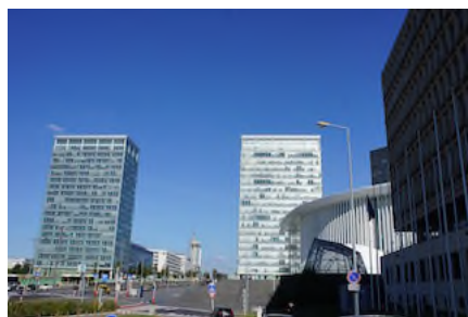
ルクセンブルク新市街