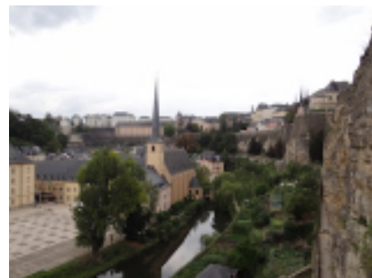
ルクセンブルク旧市街