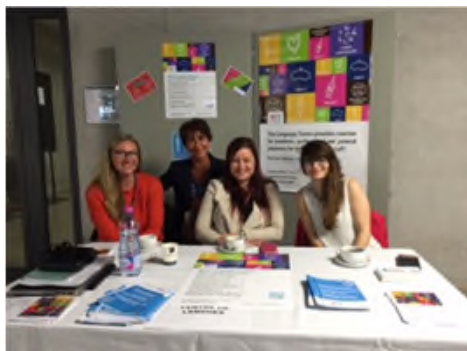
大学語学センターのブース