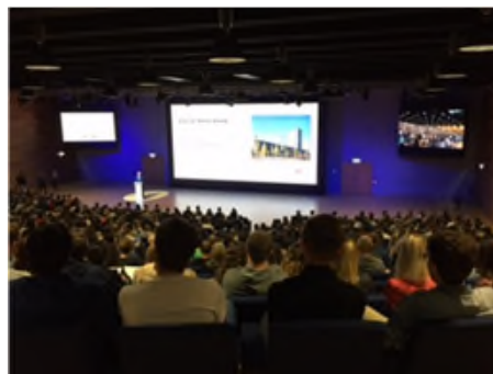
ホールにて学長挨拶