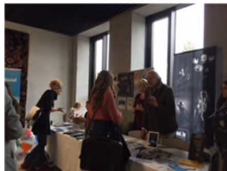
文化活動の情報を聞くことができる