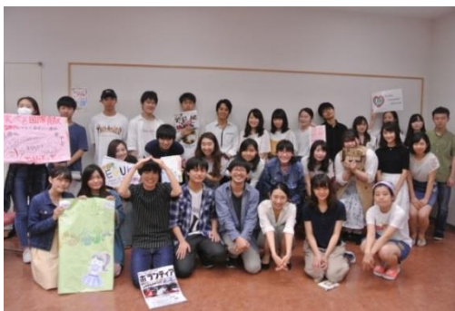
参加者総勢32名で記念撮影

Twitter : https://twitter.com/sophia_VoPla